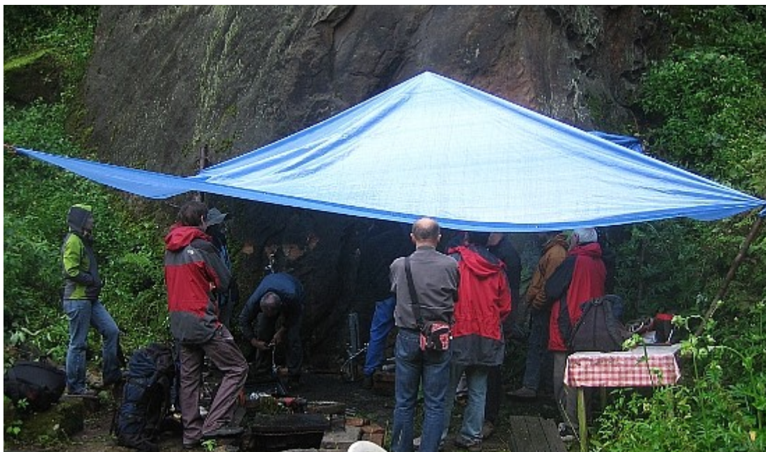
Celkový pohled na část zastřešené stěny, kde probíhaly trhací zkoušky BH a kruhů..