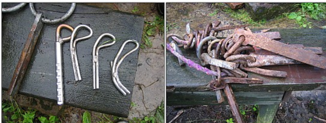
Včetně nejrůznějšího "šrotu" vytaženého při výměnách ze skal. První BH zleva je normovaný pro srovnání...