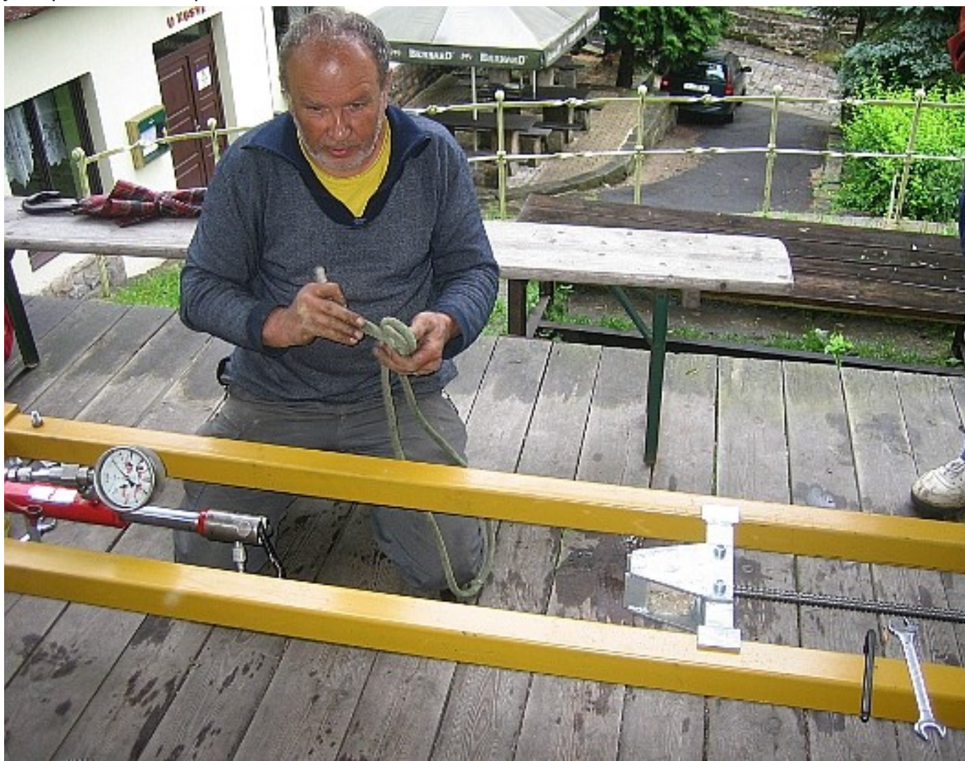
Příprava trhacího skřípce na smyčky..

Na závěr školení bylo podrobena právu útrpnému několik smyček stablek neznámého původu a stáří. Některé se natahovaly téměř donekonečna a né a né prasknout, jiné to vzdaly hned. Je to ošemetná záležitost – na pohled lze stěží odhadnout, co smyčka vydrží, proto je důležité uplatňovat princip preventivní opatrnosti a stabilky pokud možno nepoužívat (nedůvěřovat). Hlavně ty v hodinách jsou po čase nebezpečné.