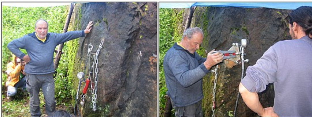
Trháme do všech stran..