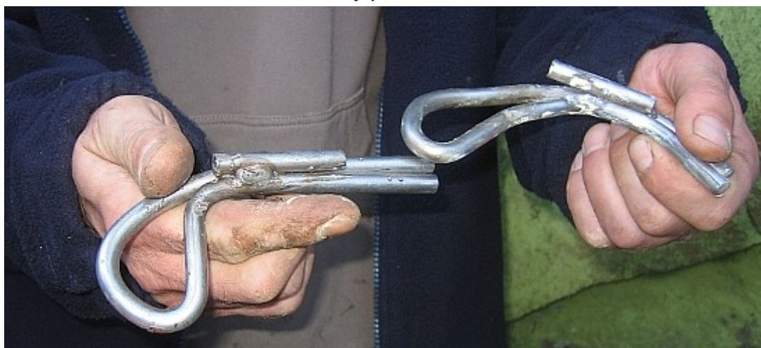
Tyhle krat'ouneké BH pochází z cest Lukáše Čermáka. Předsedovi OVK dělají vrásky na čele – takhle si bezpečné jištění nepředstavuje..